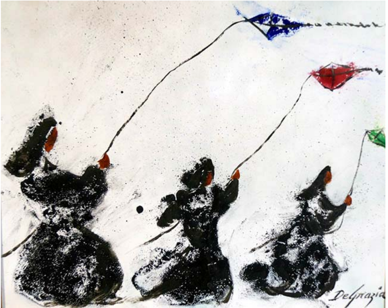
"Untitled", esmalte sobre cobre, sin fecha