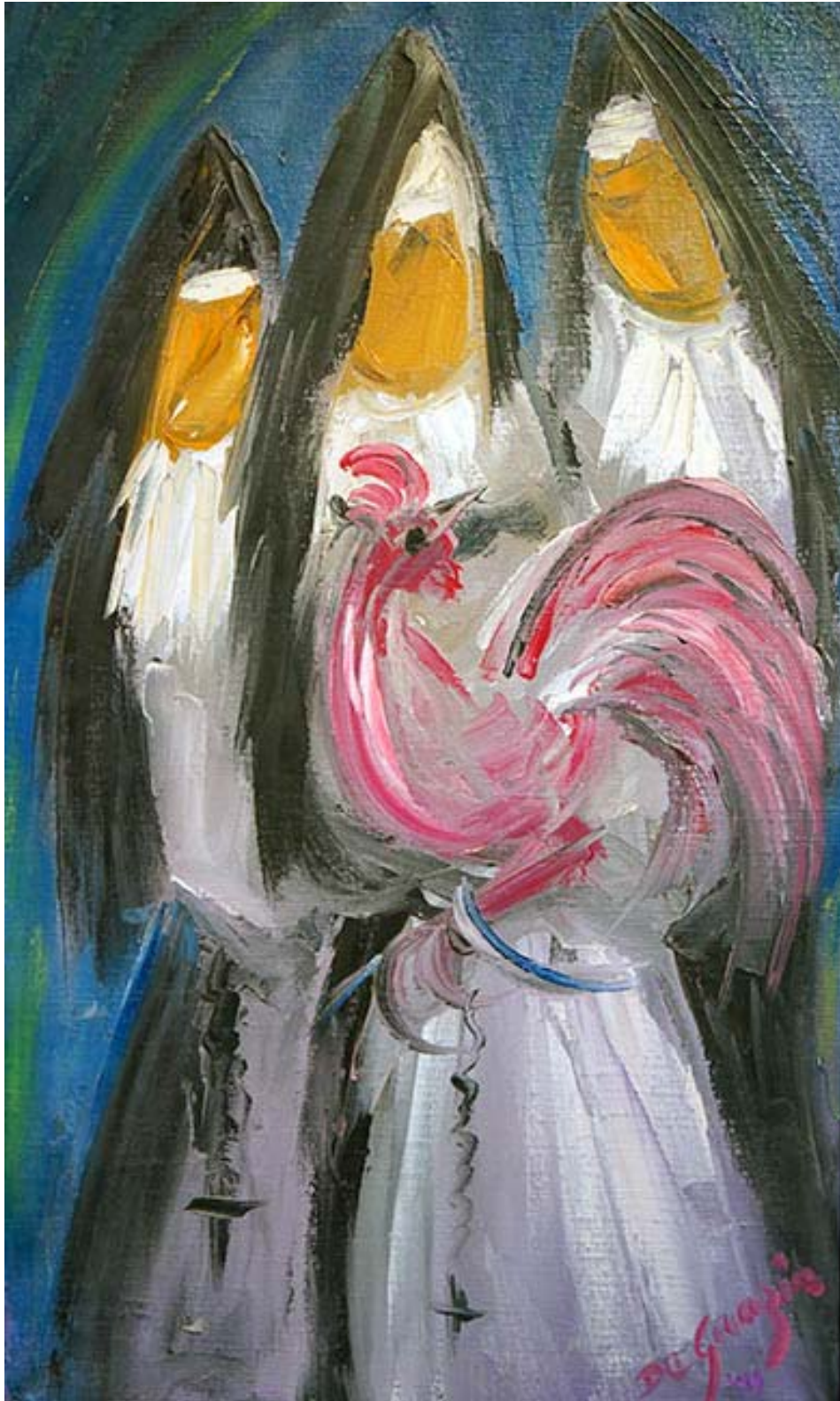
"Three Nuns", oleo sobre lienzo, 1949.