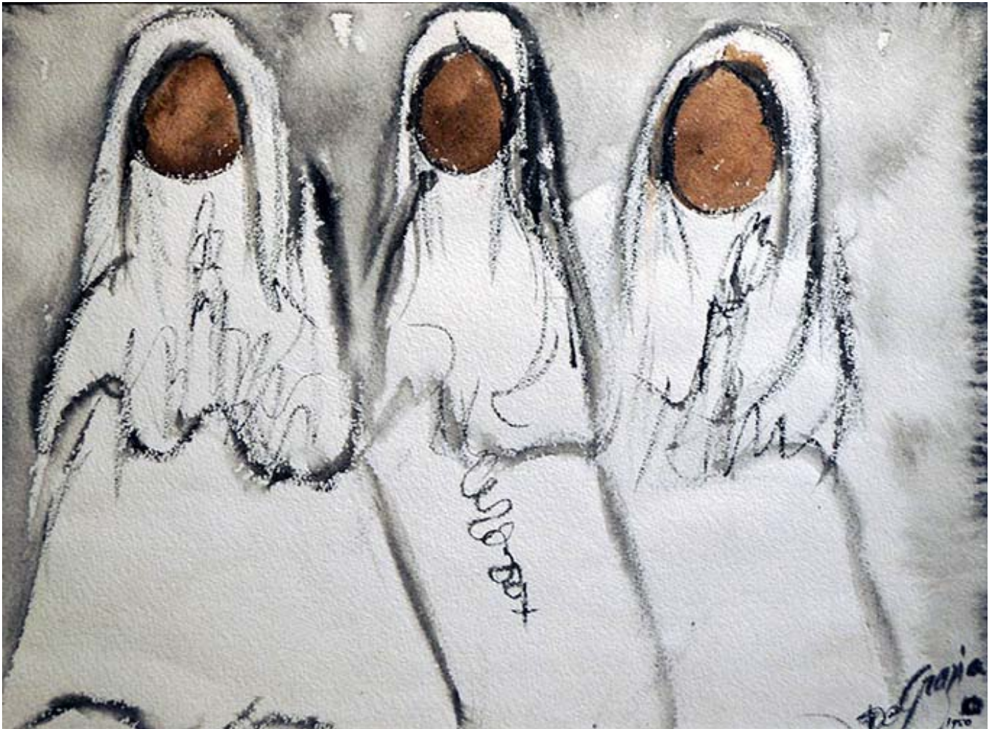
"Untitled", acuarela, 1950

Estas son algunas imágenes exhibidas en la exposición temporal DeGrazia's Nuns en la Gallery in the Sun: