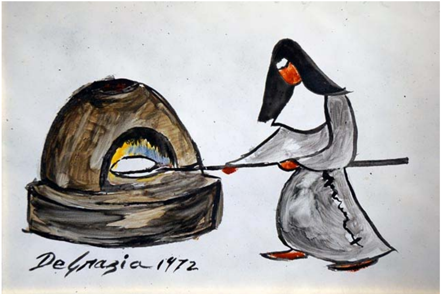
"Untitled", esmalte sobre cobre, 1972