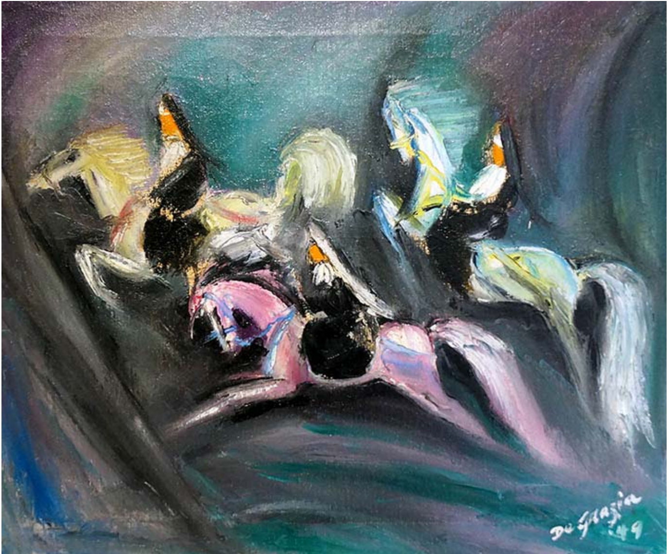
"Three Nuns", oleo sobre lienzo, 1949