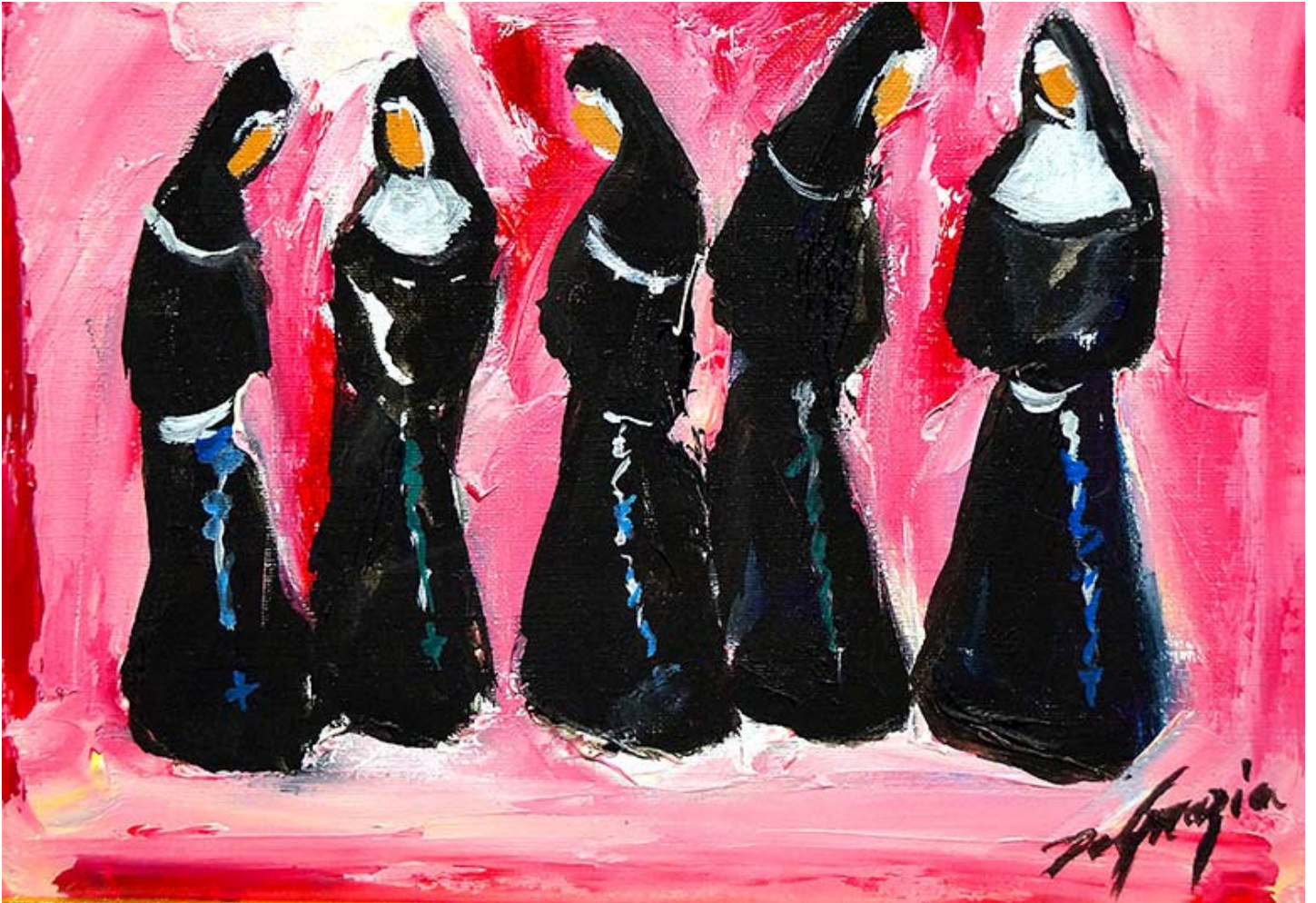
"Nuns", óleo sobre lienzo, 1949