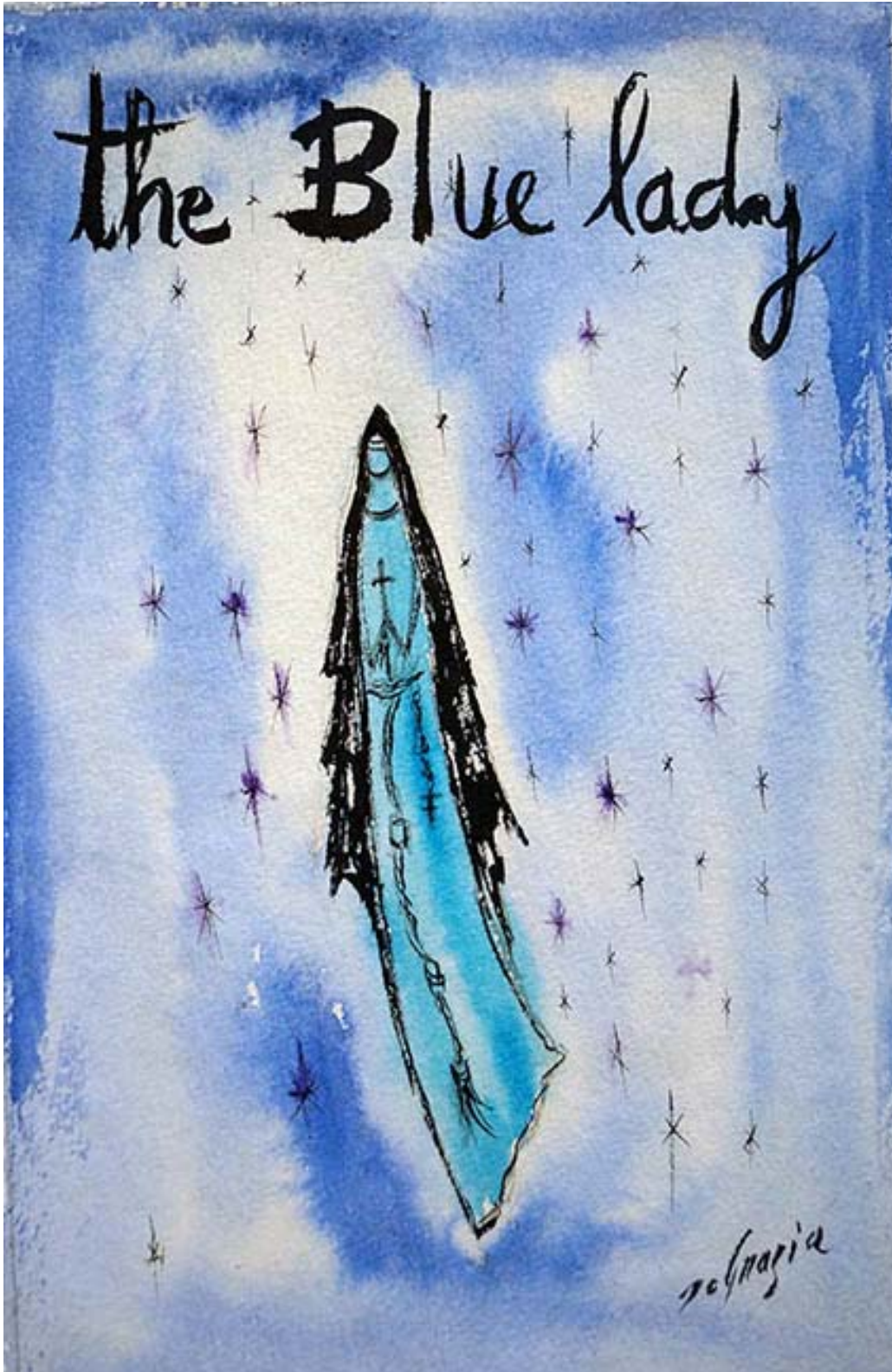
Blue Lady", acuarela, sin fecha