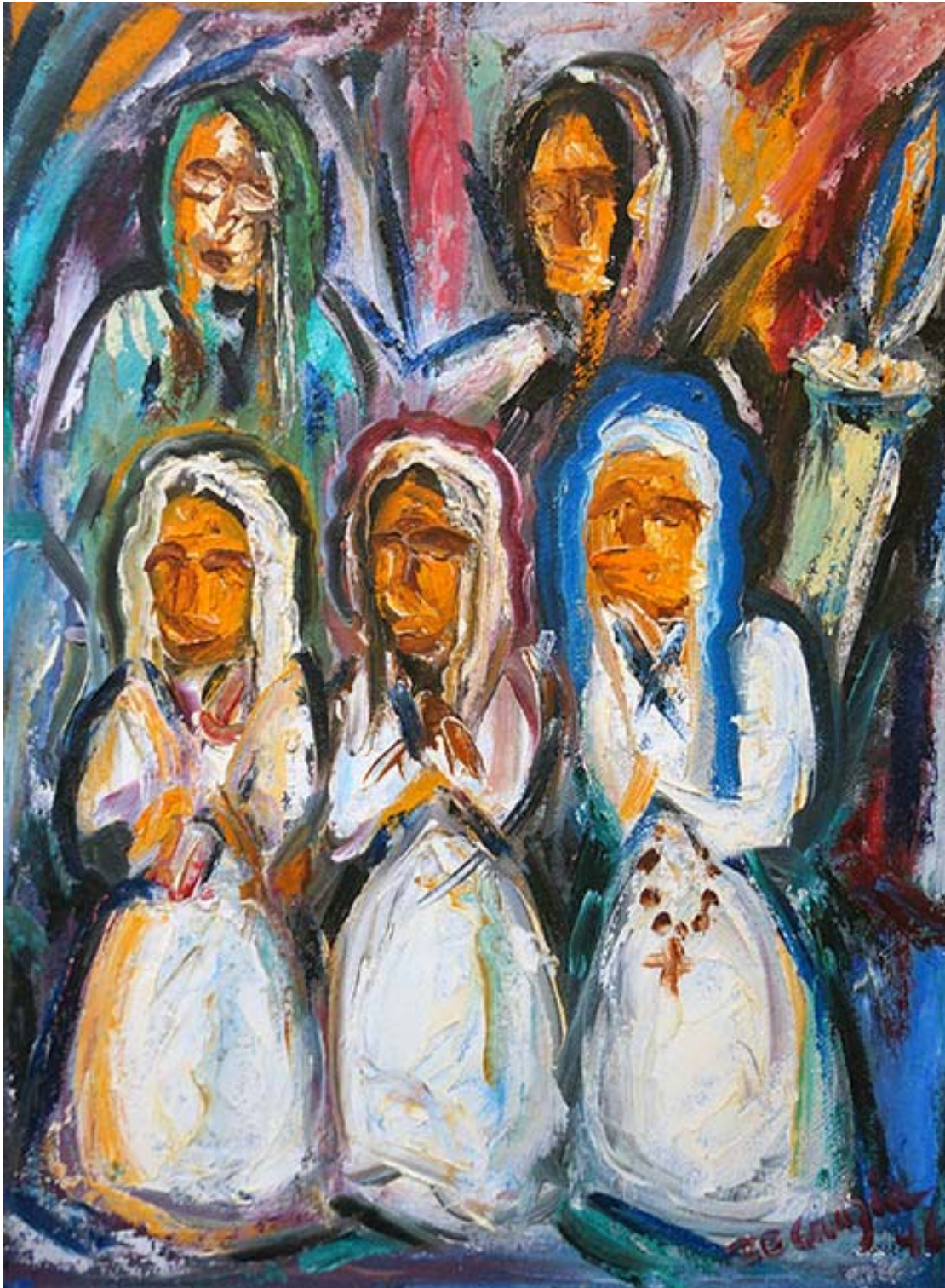
"Prayers", óleo sobre masonita, 1946